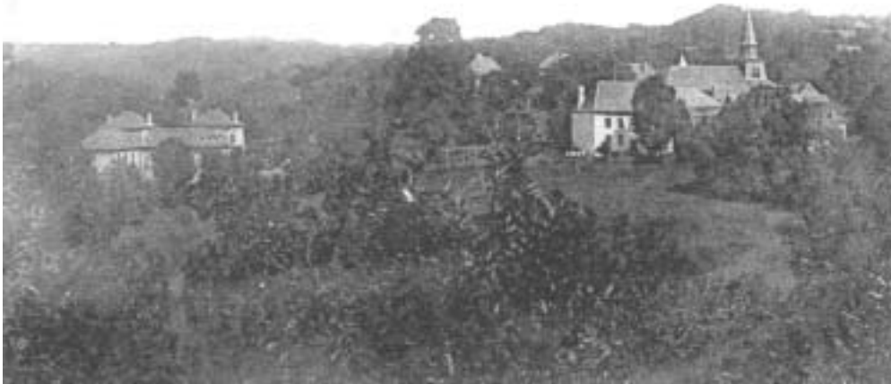
Saint Ybard Vue d'ensemble en 1900.