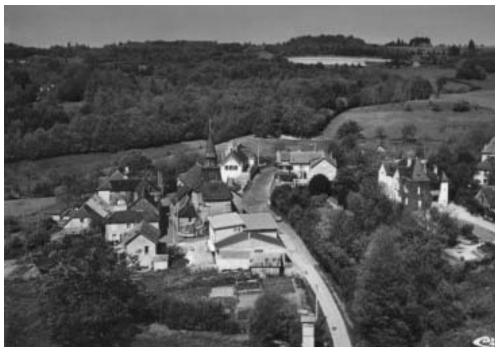
Vue aérienne de Saint Ybard ( 1960 )