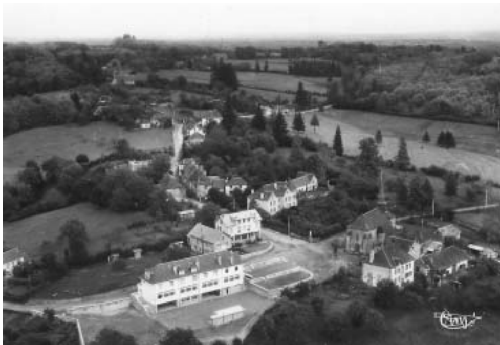
Vue aérienne de Saint Ybard ( 1960 )