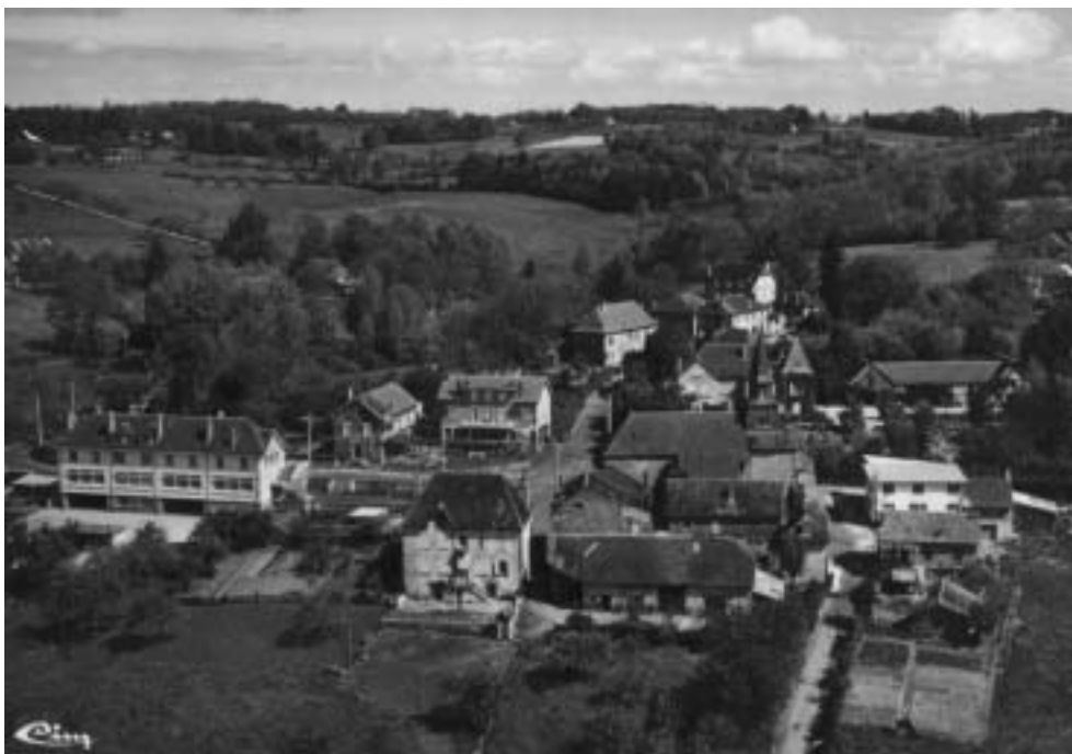
Vue aérienne de Saint Ybard ( 1960 )