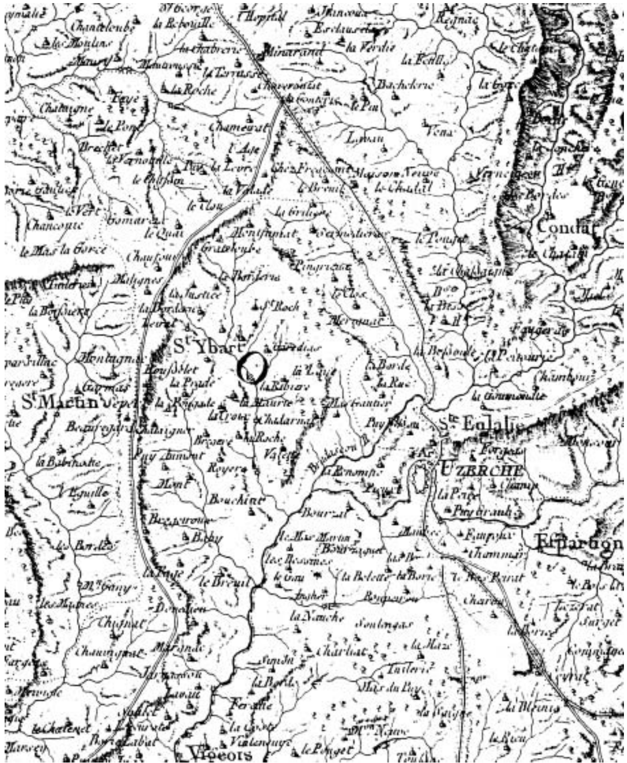
Carte ancienne de la commune.